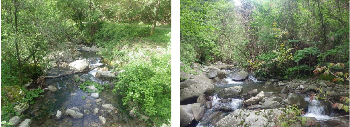
Figura 1 e 2 – Tributario destro Adelano, in località “Chiusola”, nei pressi di SP1 e Centro Sportivo Equestre “Il Corsiero Italiano” ASD, vista del tratto campionato.

CARATTERIZZAZIONE DELLA FAUNA ITTICA TRIBUTARIO DESTRO ADELANO - STAZIONE 01