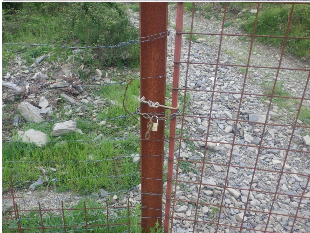
Figura 7 e 8 – Inaccessibilità ZSC oltre via Frandalini.