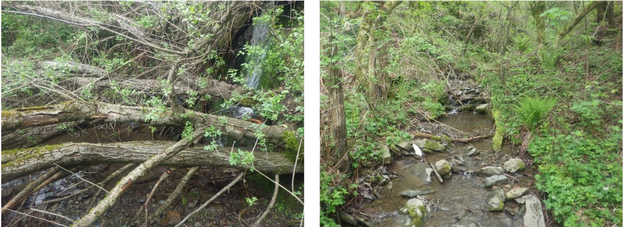
Figura 4 e 5 – Rio Fosso del Monte, in località “Villaggio del Rastrello”, confine Est ZSC e Toscana