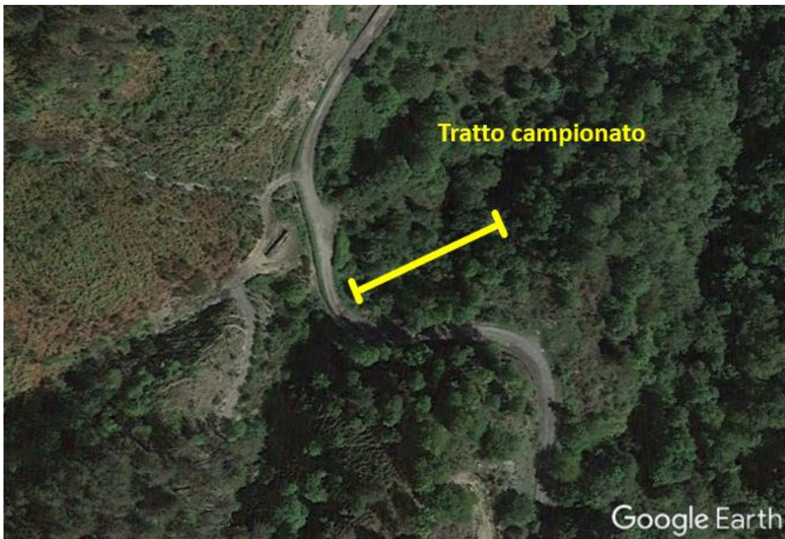
Figura 6 - Collocazione della stazione 02 sul Rio Fosso del Monte